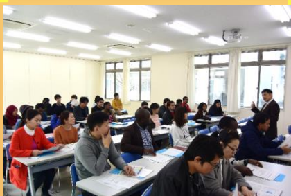
プログラムコーディネーターの話に 耳を傾けるリーディングコース生